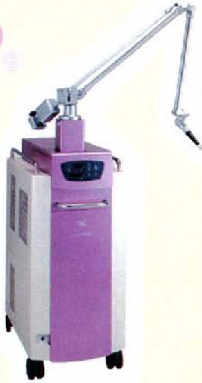
Qスイッチルビーレーザー

治療に使用されるルビーレーザーの光は、正常な皮膚や血管にはほとんど吸収されず、メラニンなどの色素によく吸収される性質があります。そのため、正常組織への損傷を最小限に抑えながらシミ・アザ等の色素を選択的に破壊し治療します。また傷あとを残す心配がほとんどありません。