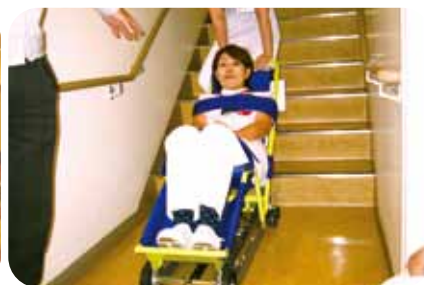
2010/10/30 非常用階段避難車を使用して防災訓練