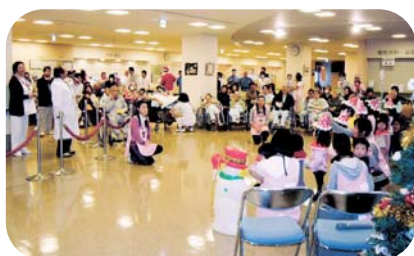
2008/12/20 クリスマスコンサート