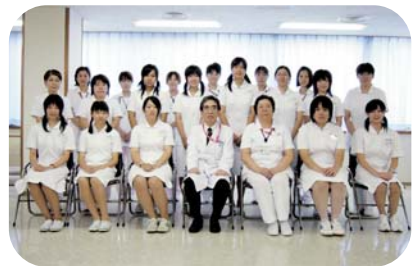
2008/08/10 ふれあい看護体験