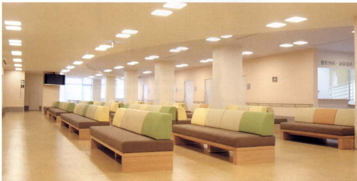
新館1階（内科・整形外科・泌尿器科待合ロビー）

平成15年より進めておりました病院施設の増改築工事が竣工致しました。皆様には大変ご不便をおかけしましてご協力に感謝申し上げます。