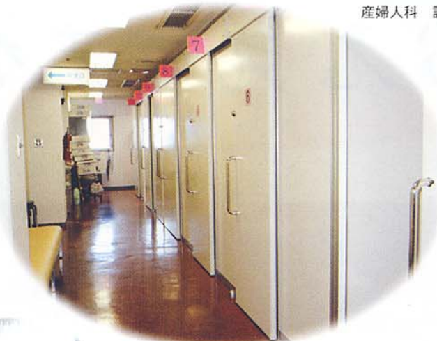
産婦人科 診察室前

この度、患者様のプライバシー保護を主目的に産科・婦人科外来の診察室を個室タイプとし、内診台も新しく電動式に交換して患者様が安心して診察が受けられるように致しました。