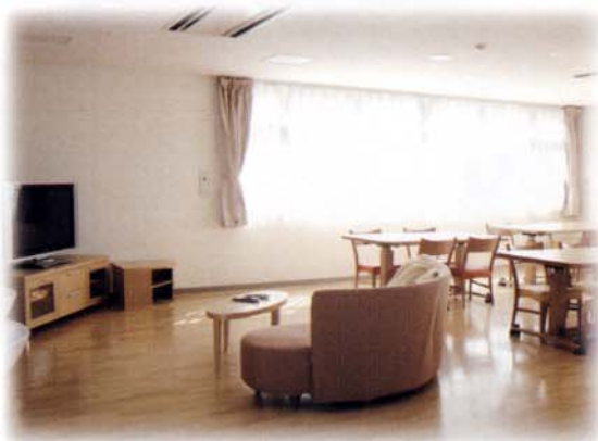
新館2階 デイルーム