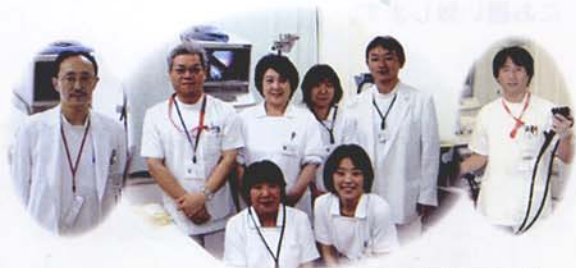
内視鏡検査担当職員